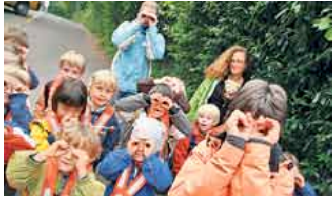
«Guten Morgen, Vögel.» Die Kinder begrüßen und beobachten die Tiere der Umgebung.