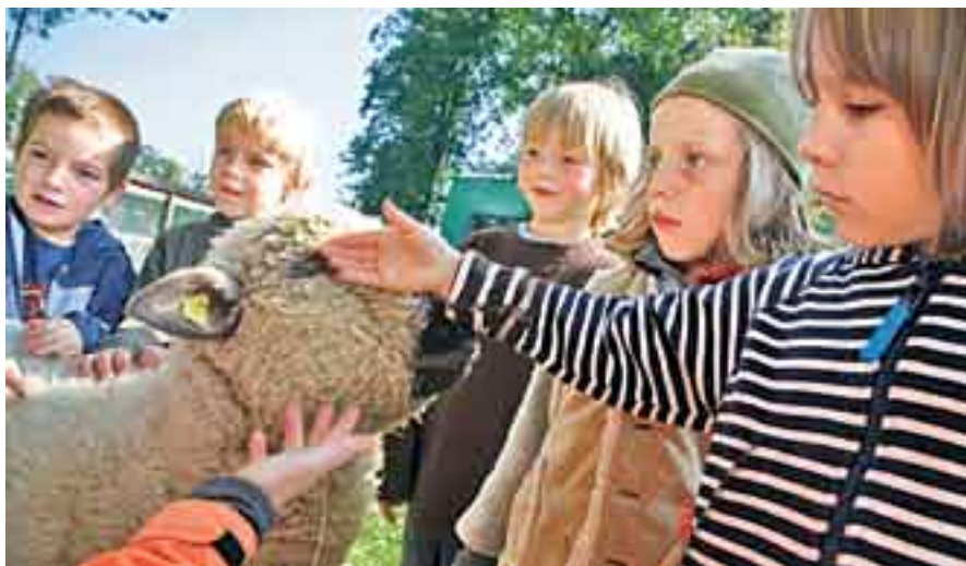
Die Kinder strecken den Schafen ihre Hand hin und lassen sie schnuppern.

Kindergarten- und Schulklassen (Kinder im Alter bis zu 10 Jahren) haben die Möglichkeit, einen halbtägigen Schnupperkurs an der «Ethikschule Kind und Tier» zu gewinnen. Einfach genaue Angaben der Schulklasse (Name der Lehrperson, Adresse, Telefonnummer) senden an: Coop, Ethikschule, Postfach, 4091 Basel. Einsendeschluss ist der 23. Oktober. Die Gewinner-Klassen werden schriftlich benachrichtigt. Termine und Administratives werden mit den jeweiligen Lehrkräften abgesprochen.